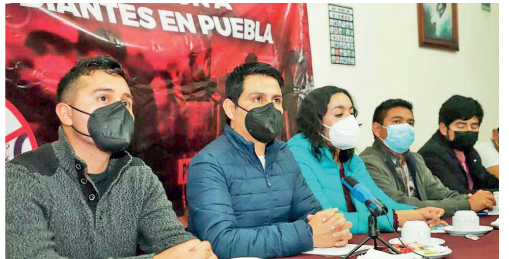
ANUNCIARON UNA NUEVA MARCHA DE ESTUDIANTES ANTE LA RESPUESTA NULA DE LA AUTORIDAD ESTATAL Y MUNICIPAL PARA LA DONACIÓN DEL TERRENO PARA LA CONSTRUCCIÓN BACHILLERATO DIGITAL 283.