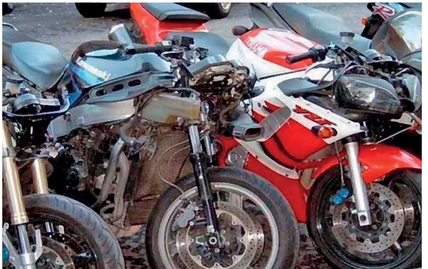
En la comunidad de San Diego Chalma fue detectado un depósito de motocicletas robadas, las cuales eran transportadas a la Sierra Negra para venderlas en 3 mil pesos