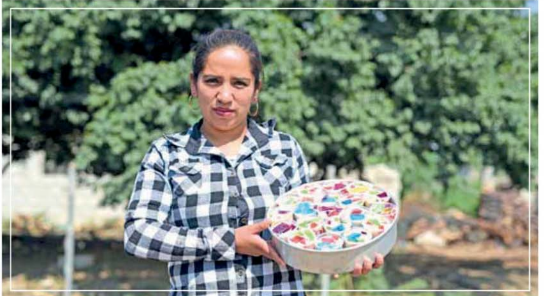
BENEFICIA GCM CON CURSOS A 1 MIL 100 PERSONAS EN 52 POBLACIONES