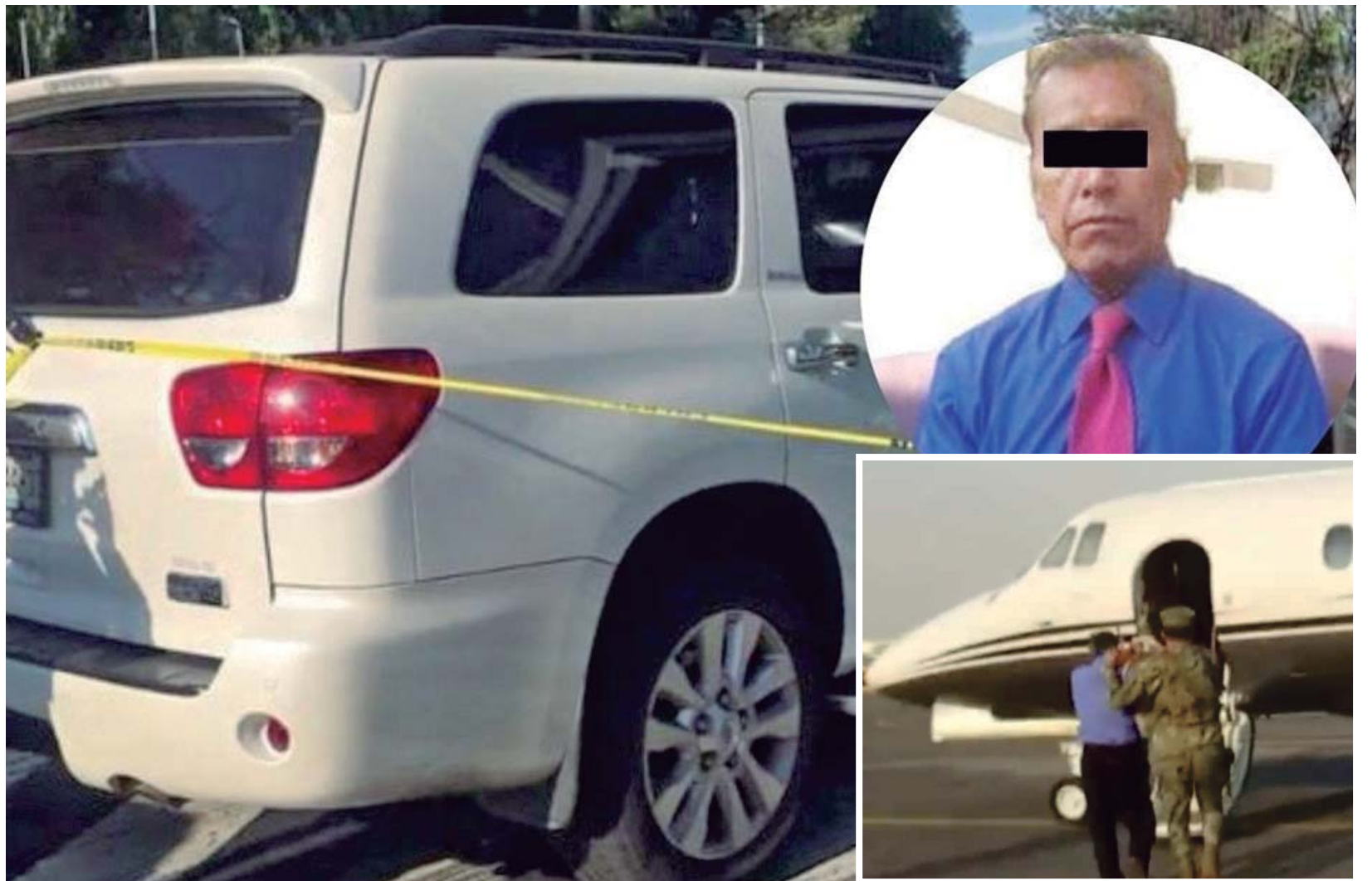
Quien fuera secretario de Seguridad en Puebla fue trasladado al penal de Sonora

● Por la mañana de ayer fue detenido por matar con su vehículo a una persona. Por la tarde ejecutaron la orden de aprehensión por estar involucrado en el operativo Rápido y Furioso.