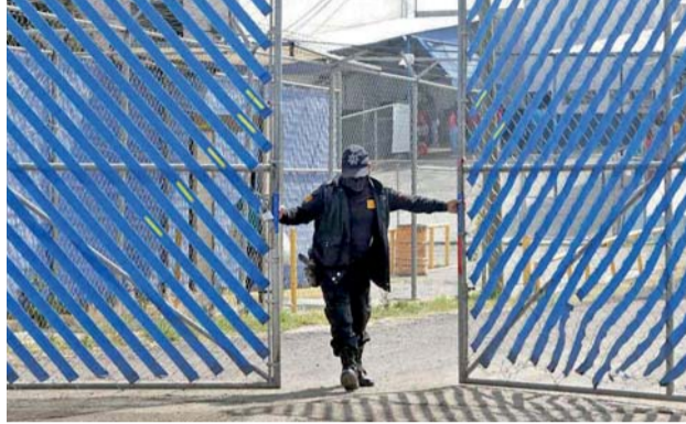
ROBARON SU CUERPO DEL PANTEÓN EN IZTAPALAPA, LO TRASLADARON A PUEBLA Y LO INTRODUCIERON AL PENAL SAN MIGUEL

Puebla, Pue. El misterio prevalece en el penal San Miguel de Puebla por la aparición de un bebé muerto en un bote de basura el pasado 10 de enero.