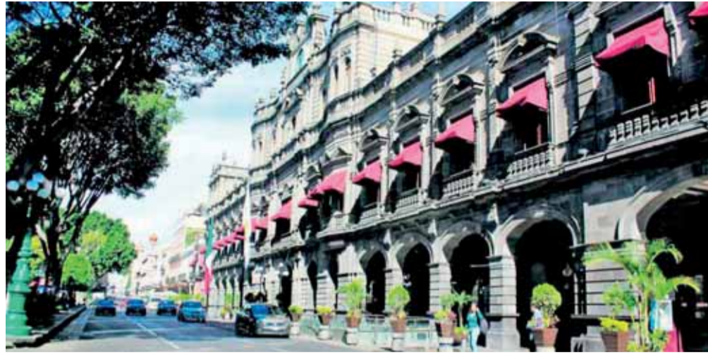
RIVERA PÉREZ COMENTÓ QUE ESTE NÚMERO ES MÍNIMO, PUES SÓLO REPRESENTA EL 1.61 POR CIENTO DE LOS MÁS DE 6 MIL 200 TRABAJADORES.

Puebla, Pue. El presidente municipal Eduardo Rivera Pérez informó que con la llegada de la cuarta ola de contagios Covid-19, en las oficinas del Ayuntamiento de Puebla se han registrado 100 casos, por ello se tomarán medidas como reuniones virtuales y otras acciones para evitar aglomeraciones al interior.