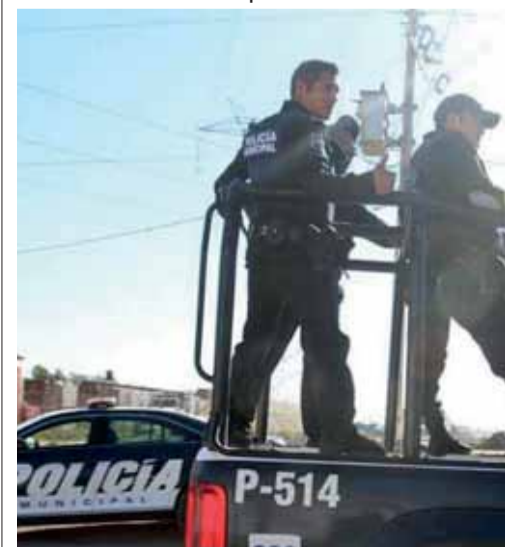
DE LAS 339 REMISIONES, 53 FUERON ANTE LA JUSTICIA CÍVICA, 264 AL MINISTERIO PÚBLICO, TRES AL MINISTERIO PÚBLICO DE ADOLESCENTES Y NUEVE AL MINISTERIO PÚBLICO FEDERAL.

Comentó que el día de ayer (5 de enero) si hubo presencia de policías en dicha vialidad, pero esto pasó por petición de las instancias encargadas de la Vía Pública, es decir, la Secretaría de Gobernación Municipal.