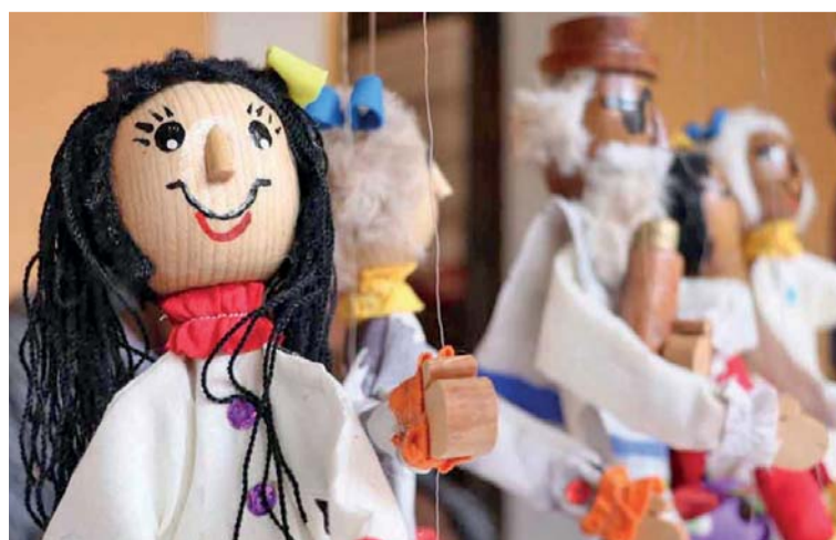
EN ESTE EVENTO PARTICIPAN 25 ARTESANAS Y ARTESANOS.