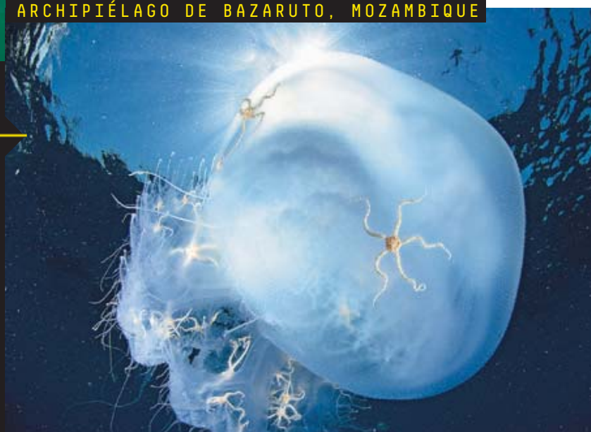
ARCHIPIÉLAGO DE BAZARUTO, MOZAMBIQUE