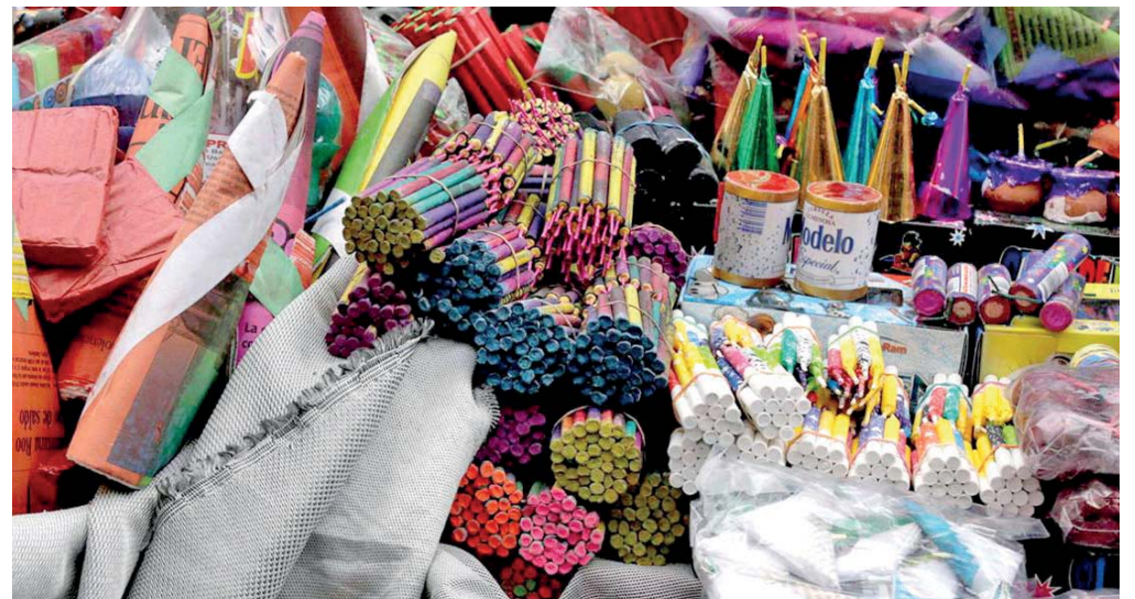
LA DIPUTADA DE MORENA, RECORDÓ QUE EN PUEBLA YA SE HAN REGISTRADO DOS SUCESOS MUY LAMENTABLES DONDE SE REGISTRARON MUERTES POR LA EXPLOSIÓN DE POLVORINES