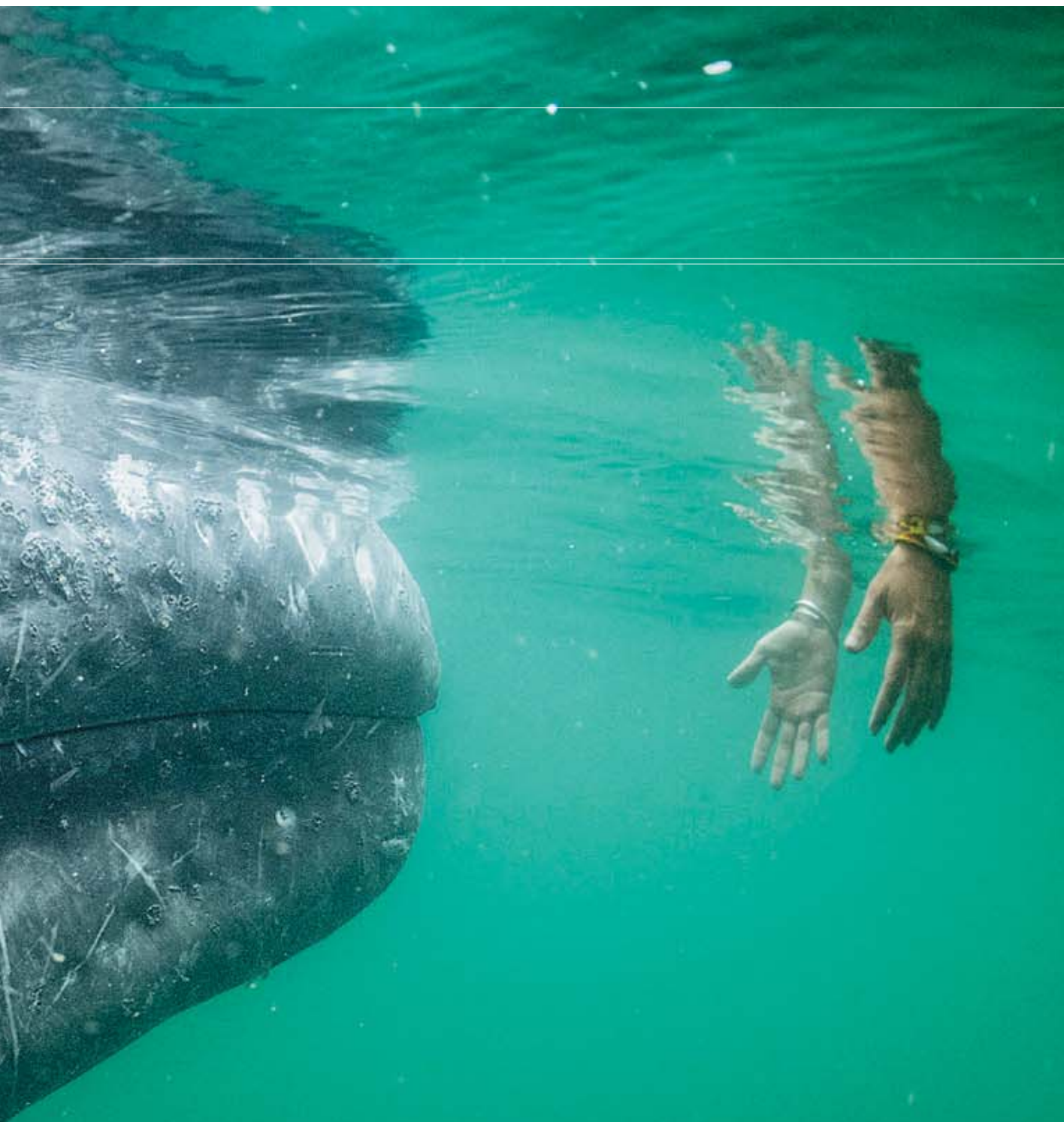
BAJA CALIFORNIA, MÉXICO