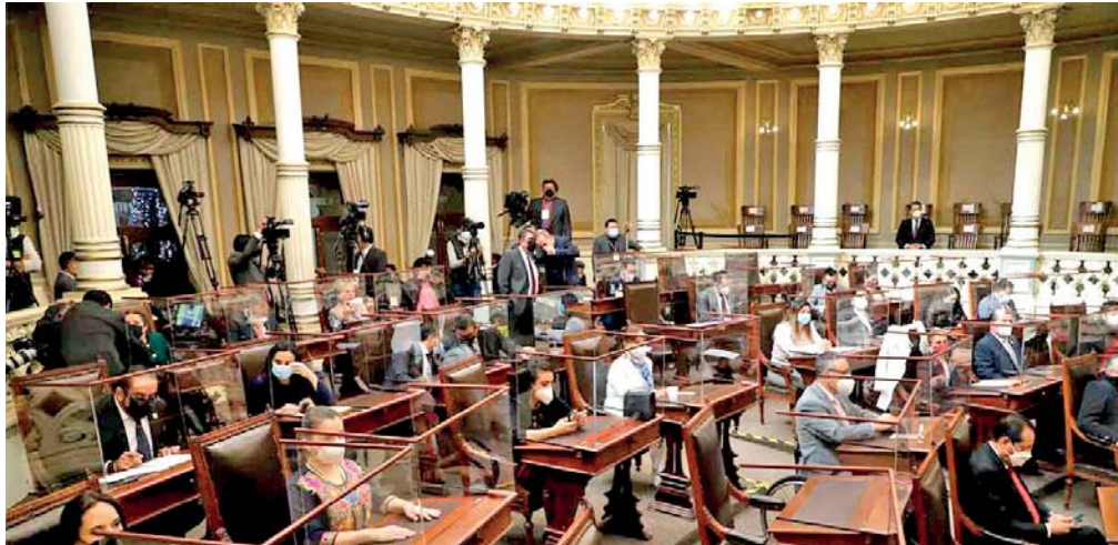
LA MAYORÍA SE LOS DIPUTADOS RECONOCIERON QUE EL ESCENARIO QUE MARCO LA PANDEMIA POR COVID-19, SIGUE SIENDO UNO DE LOS RETOS QUE MÁS PREOCUPA, TAMBIÉN ADMITIERON QUE HOY MÁS DEL 80 POR CIENTO DE LOS POBLANOS CUENTA CON SU CUADRO DE VACUNA COMPLETO.

Puebla, Pue. Sin la presencia del gobernador de Puebla, Luis Miguel Barbosa Huerta, los siete diputados locales representantes de partidos de la oposición y afines a Morena fijaron su postura respecto al tercer informe de labores que sería entregado por el Ejecutivo local después de las 11 horas de este 14 de diciembre.