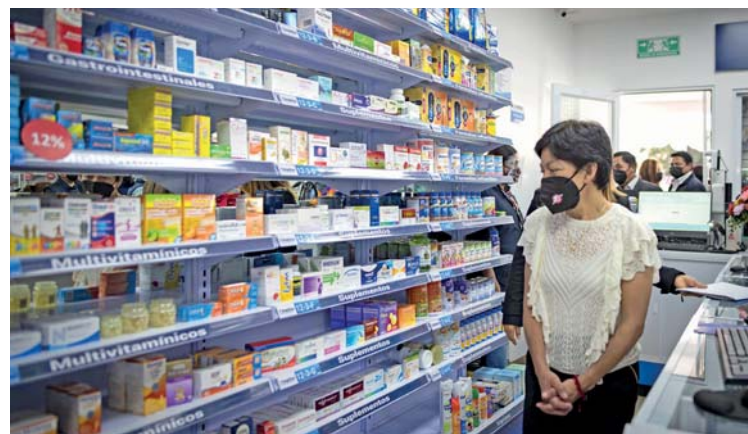
LA SUCURSAL DE HUEJOTZINGO BRINDARÁ A SUS USUARIOS EL SERVICIO A DOMICILIO SIN COSTO, CON HORARIO DE ATENCIÓN DE 24 HORAS.

Un servicio durante 35 años con calidez humana