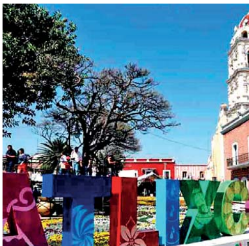
LA PRESIDENTA MUNICIPAL ARIADNA AYALA HA INSTRUIDO IMPLEMENTAR ESTRATEGIAS PARA SACAR A ATLIXCO DE LA ALERTA DE GÉNERO QUE ESTÁ ACTIVA DESDE 2019.

La UAM se ubica en las instalaciones del DIF Municipal (17 norte #1205, Solares Chicos) y todos los servicios que presta son gratuitos. ● PAOLA AROCHE