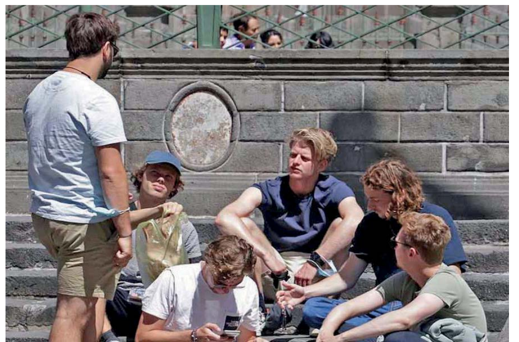
AUNQUE SE BUSCA INCREMENTAR EL PORCENTAJE DE ESTADÍA TURÍSTICA, ES UN ESCENARIO COMPLICADO, PUES LAS PERSONAS VIENEN SALIENDO DEL CONFINAMIENTO.

En otro tema, dijo que el mercado del Alto, luego de su renovación se converti-