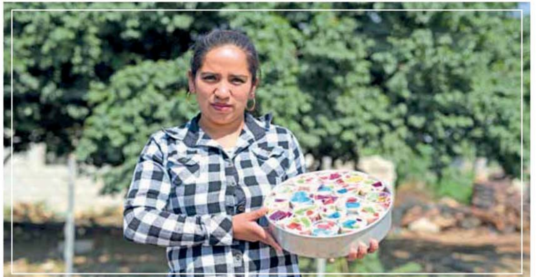
BENEFICIA GCM CON CURSOS A 1 MIL 100 PERSONAS EN 52 POBLACIONES