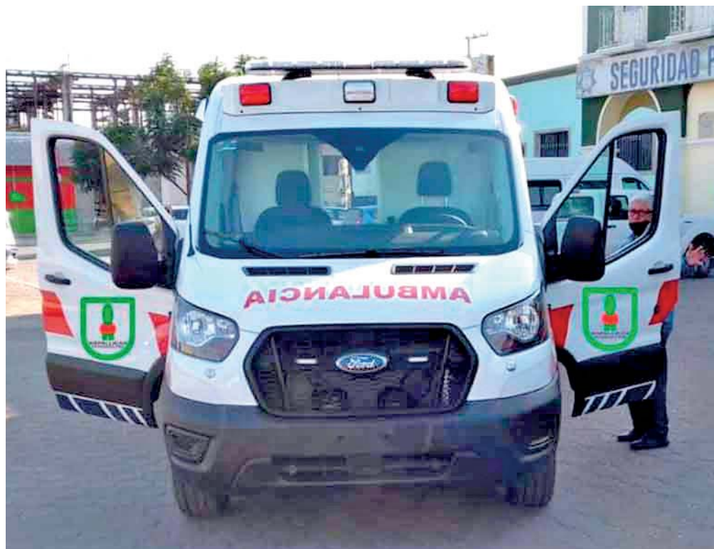
SE BUSCA BENEFICIAR LA SALUD DE LA POBLACIÓN, YA QUE SE FACILITA LA ATENCIÓN INMEDIATA DE CUALQUIER EMERGENCIA.

José Gregorio Ojeda gobierna el municipio por tercera ocasión