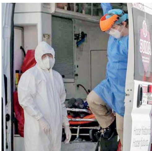
RESULTA DE VITAL IMPORTANCIA QUE PERSONAL MÉDICO SE LES PRESTÉ ATENCIÓN PSICOLÓGICA.