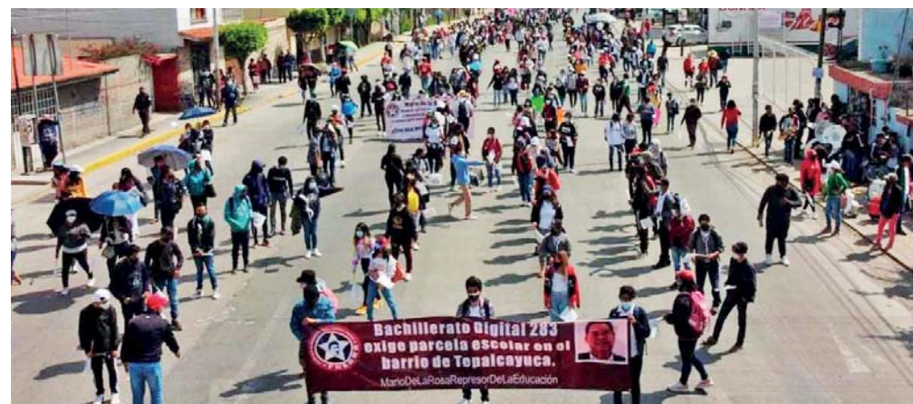
RECORDEMOS QUE DESDE HACE UN TIEMPO LA FNERRR HA CRITICADO QUE EL MUNICIPE NO HAYA CUMPLIDO CON SU PROMESA DE HACER LA DONACIÓN DEL TERRENO PARA QUE SE CONSTRUYA EL BACHILLERATO DIGITAL 283.

Puebla, Pue. La Federación Nacional de Estudiantes Revolucionarios "Rafael Ramírez" (FNERRR), anunciaron una megamarcha, así como un evento cultural para este miércoles 8 de diciembre contra el alcalde de Amozoc, Mario de la Rosa, pues el terreno que se comprometió a otorgar para construir el Bachillerato Digital 283, ya se construye un Centro Escolar.