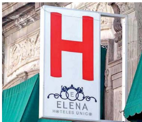
CON LOS EVENTOS QUE SE HAN REALIZADO EN EL ESTADO SÍ EXISTE HOSPEDAJE DURANTE LOS FINES DE SEMANA, POR LO QUE ESPERAN TERMINAR DICIEMBRE AL 50 POR CIENTO DE OCUPACIÓN, SIN EMBARGO, LO VIO MUY COMPLICADO.

Puebla, Pue. La Asociación Poblana de Hoteles y Moteles sugirió al gobierno estatal realizar la estrategia “¡Que Reviva Puebla!”, fuera de la entidad poblana, debido a que a ellos no los beneficia, pues ayuda al comercio local y restaurantes.