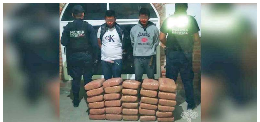
Los dos detenidos circulaban en la carretera Huehuetlán el Chico-Santa María Cohetzala en un taxi de Guerrero