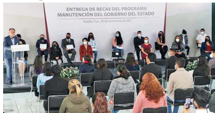
EN ESTA OCASIÓN FUERON DISTRIBUIDOS 3 MIL 216 PESOS (EN UNA SOLA EXHIBICIÓN) A 9 MIL 02 ESTUDIANTES DE 51 INSTITUCIONES DE EDUCACIÓN SUPERIOR PÚBLICAS, EXPLICÓ EL FUNCIONARIO.

Puebla, Pue- El programa "Beca Manutención del Gobierno del Estado de Puebla 2021", está enfocado al apoyo solidario para estudiantes poblanos, lo cual coadyuvará a la transformación del país, aseguró el secretario de Educación, Melitón Lozano Pérez, al encabezar la ceremonia donde entregó estos beneficios, los cuales resaltó que tienen la finalidad de atender a quien más lo necesita: "y la educación debe estar orientada en este sentido".