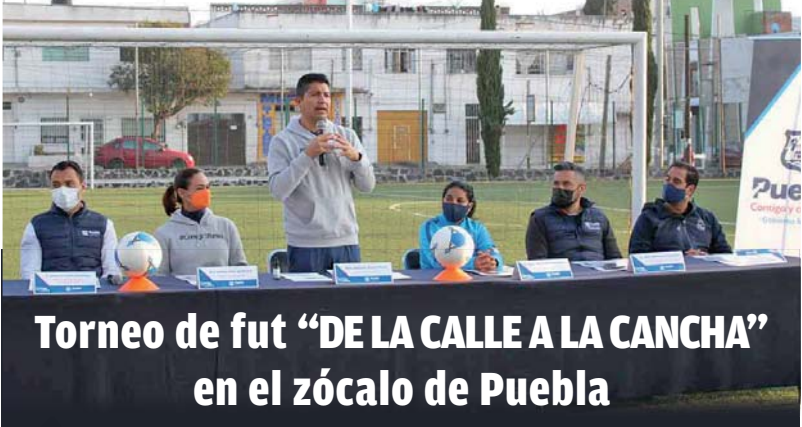
Torneo de fut "DE LA CALLE A LA CANCHA" en el zócalo de Puebla