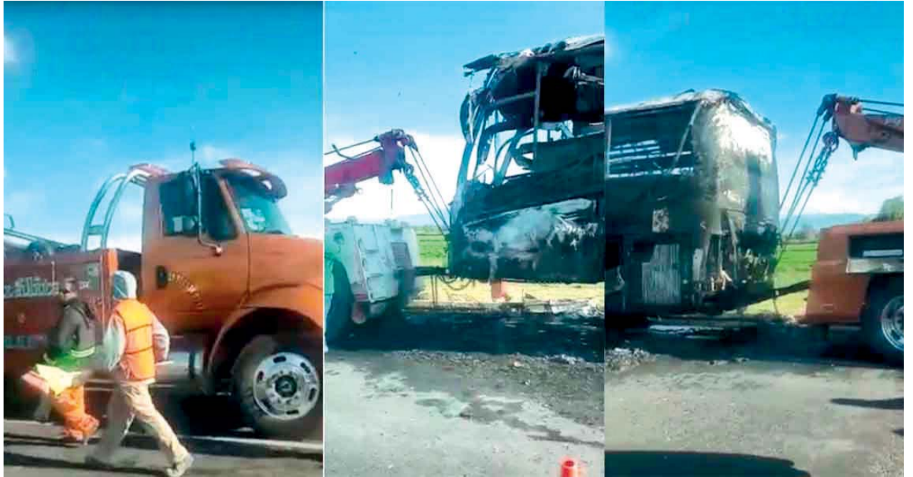
AL LUGAR LLEGÓ PERSONAL DE LA GUARDIA NACIONAL, CAPUFE, BOMBEROS Y DE PROTECCIÓN CIVIL DE LA REGIÓN PARA SOFOCAR EL FUEGO.