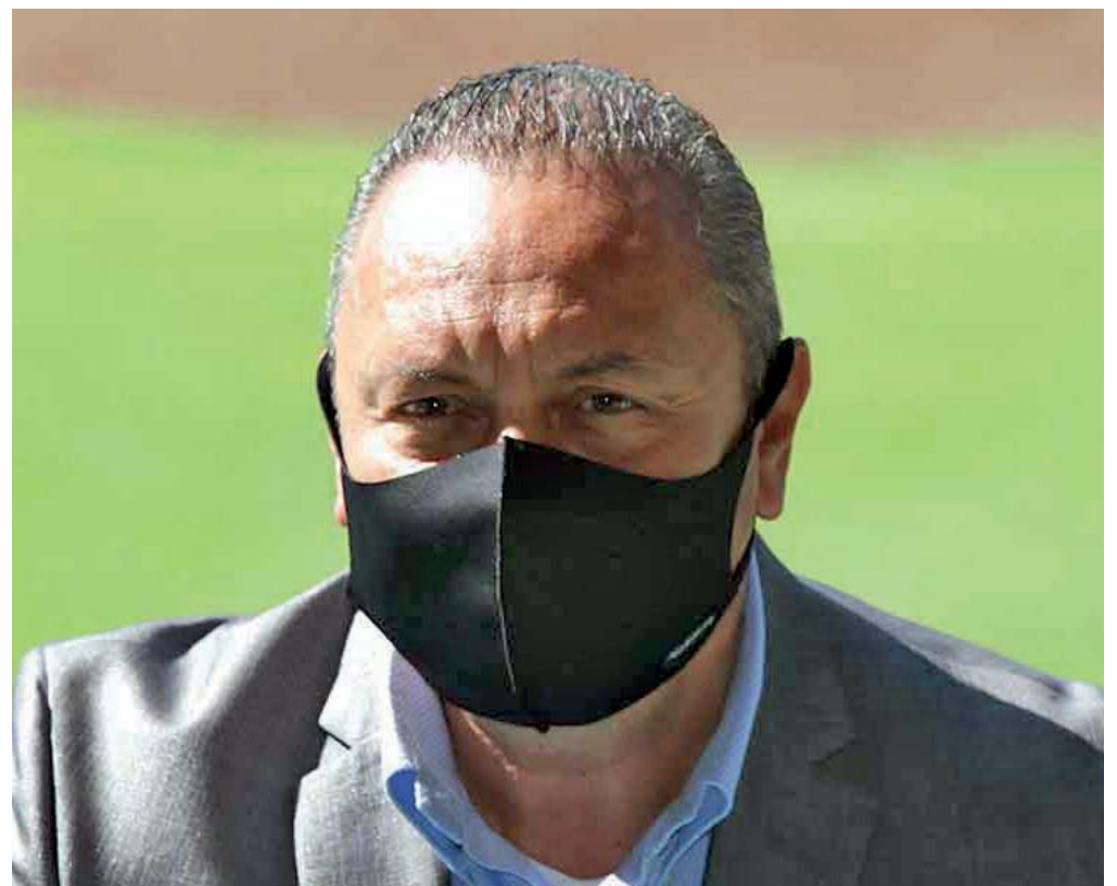
La mayoría que votó por Morena fue porque fueron comprados por Morena.

Será este martes cuando regrese a sus actividades al ayuntamiento, mientras tanto serán sus abogados quienes se encargarán de continuar con la impugnación. ● PAOLA AROCHE