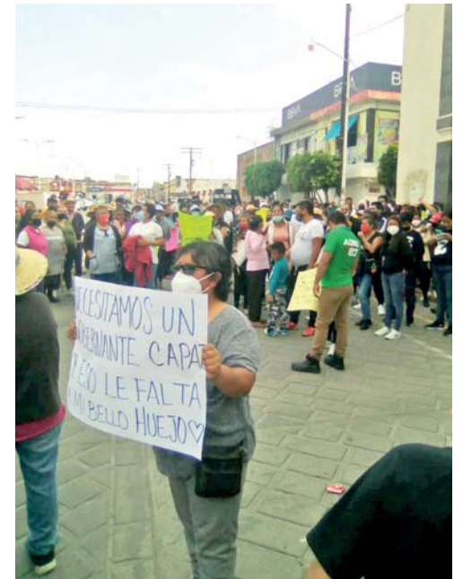
Con esta protesta los habitantes de Huejotzingo alzan la voz en contra de Angélica Alvarado y el "triunfo" obtenido en las urnas, pues afirman fue un proceso amañado y lleno de irregularidades.