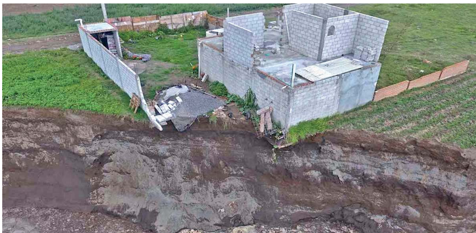
El gobernador Miguel Barbosa en su visita a Juan C. Bonilla espera reunirse con las familias afectadas por el socavón, a fin de poder conocer sus inquietudes y poder dar una respuesta.

El gobernador Miguel Barbosa Huerta anunció que el jueves 10 de junio visitará Santa María Zacatepec, junta auxiliar del municipio de Juan C. Bonilla, para conocer los daños que ha generado el socavón.