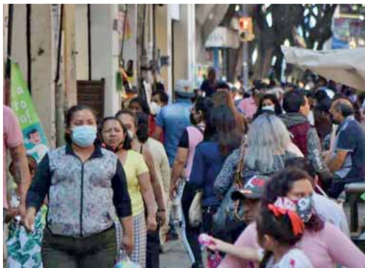
Se hizo un llamado a los poblanos para actuar lo más responsable posible y mantener un confinamiento voluntario.

Por lo que hizo un llamado a los poblanos para actuar lo más responsable