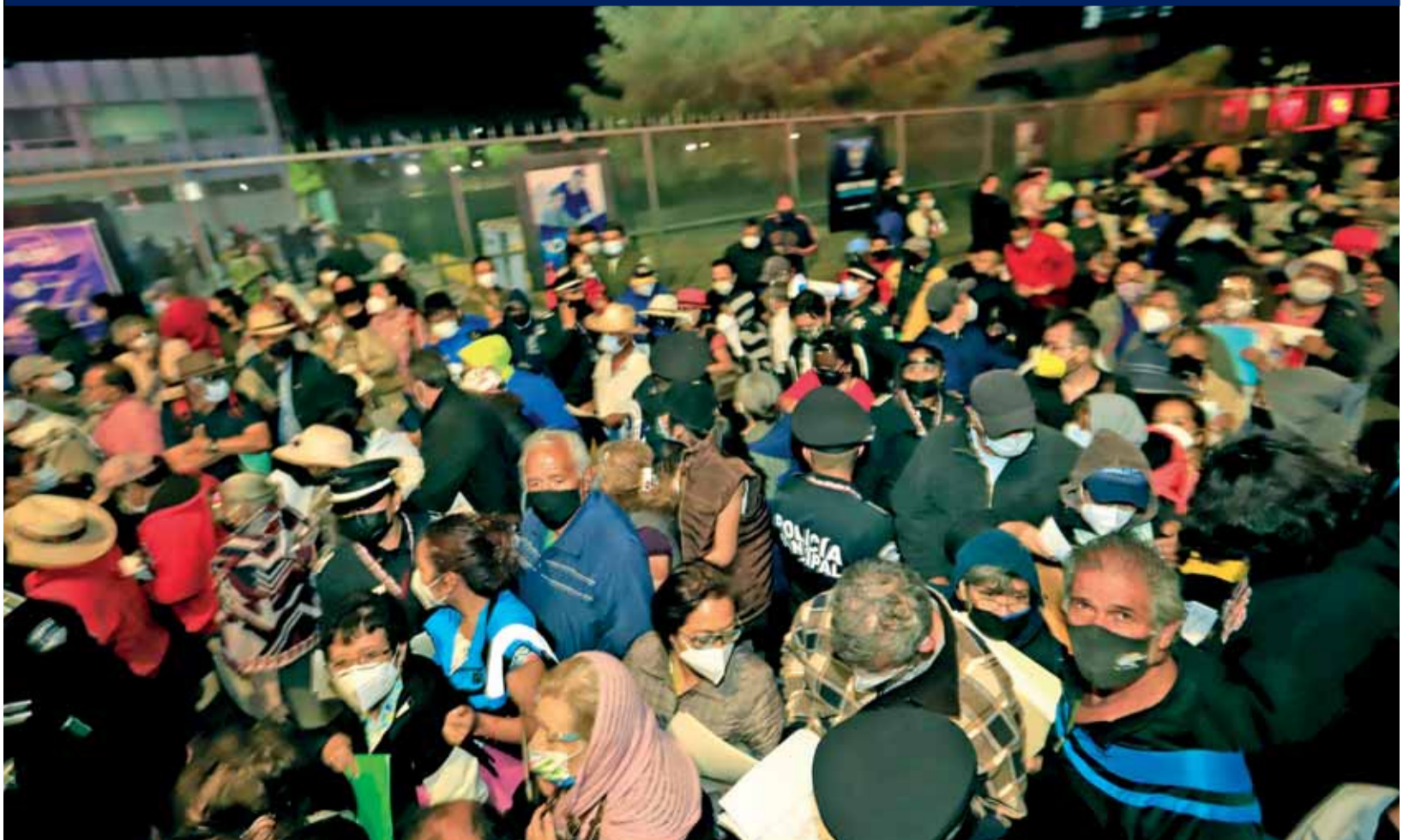
Cae la noche y cientos de personas de la tercera edad continúan formadas para ingresar a Ciudad Universitaria de la BUAP, para recibir la primera dosis de la vacuna de Covid-19. • Foto: Guadalupe Zúñiga/Agencia Enfoque