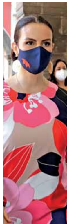
Senadora Nancy de la Sierra.

Con el objetivo de erradicar las conductas como el racismo, el clasismo, el machismo o el autoritarismo en la sociedad mexicana a través del derecho a la cultura, siendo un importante catalizador que permite que las personas abran las fronteras de su mente, eliminando prejuicios y generando empatía por el prójimo, es necesario que se destine al menos el 1 % del presupuesto federal al sector cultural, señaló la senadora Nancy de la Sierra.