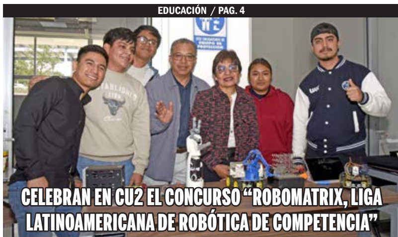
CELEBRAN EN CUZ EL CONCURSO "ROBOMATRIX, LIGA LATINOAMERICANA DE ROBÓTICA DE COMPETENCIA"