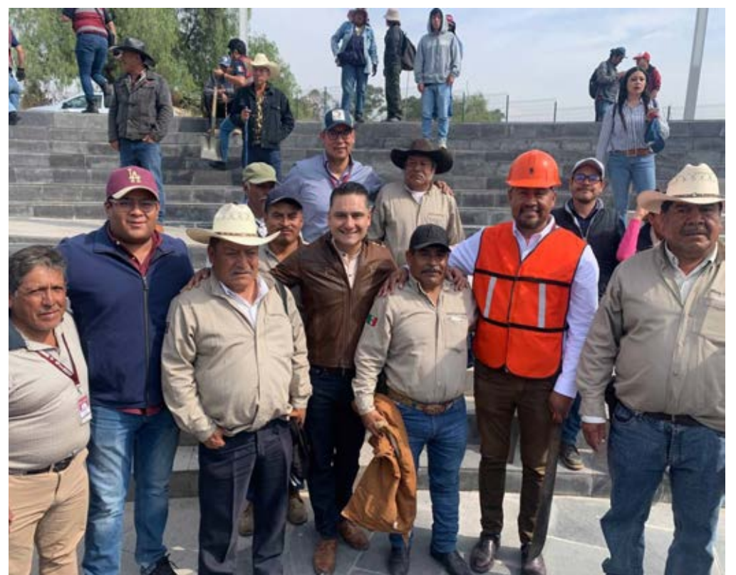
Pepe Chedraui Budib reafirma su compromiso con la protección del medio ambiente y la seguridad de la población

El Gobierno de la Ciudad que encabeza Pepe Chedraui Budib reafirma su compromiso con la protección del medio ambiente y la seguridad de la población,