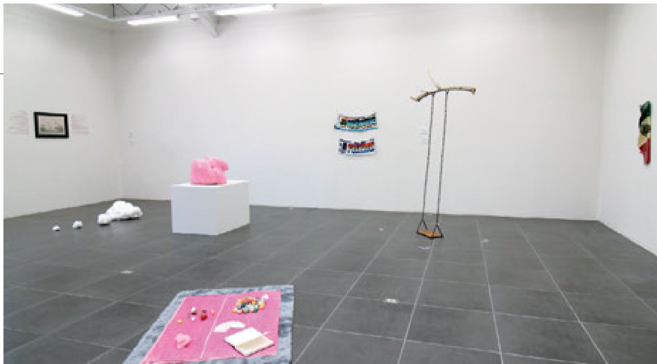
“IMAGINEMOS COSAS CHINGONAS”, de Espacio Sin Nombre, Espacio Calosa (octubre-diciembre 2024).

“Desde entonces —continúa— hemos tomado cursos y desarrollado una colección que refleja nuestros gustos, con un énfasis especial en artistas mujeres. Esto dio pie a la creación del Espacio Calosa, donde mostramos nuestras piezas para que la gente las disfrute y aprenda de ellas”.