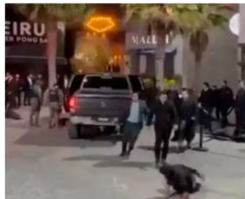
La Uespac rechazó la agresión en antro por supuesto personal de seguridad de un antro, pues no forman parte de empresas legalmente constituidas

Ante esta problemática, la Uespac hizo un llamado a los propietarios de bares y centros nocturnos para que contraten exclusivamente a personal registrado ante la Dirección General de Seguridad Pública y que haya aprobado los exámenes de control de confianza.