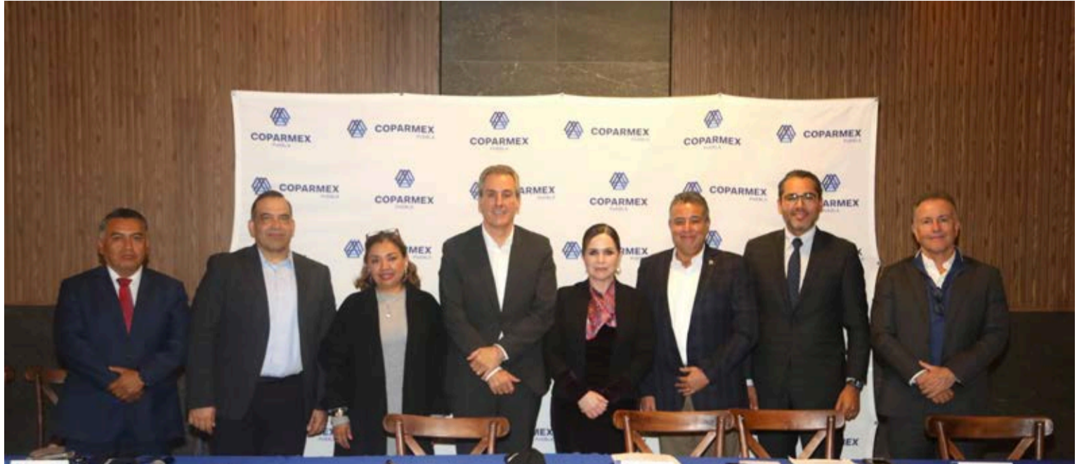
Dicho encuentro se realizó en el marco de la 1ª Sesión del Consejo Directivo de Coparmex Puebla, durante el cual, el alcalde reiteró el respaldo y coordinación de los tres órdenes de gobierno

Indico que la Línea de Apoyo consiste en tener esas mesas de trabajo para poder atender sus necesidades, a fin de que se les pueda ayudar con vivienda y trabajo. AURELIA NAVARRO