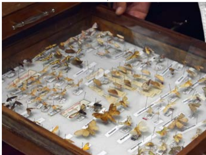
Cuenta con más de 22 mil ejemplares, que abarcan 11 órdenes, 111 familias, 258 géneros y 533 especies

Las colecciones de insectos son centros de referencia y formación de recursos humanos. “Sus objetivos fundamentales son la enseñanza, ya que al exhibirlos estudiantes y público en general pueden aprender de éstos; así como la investigación que permite su determinación taxonómica y la creación de una base de datos como apoyo didáctico y consulta para investigadores e