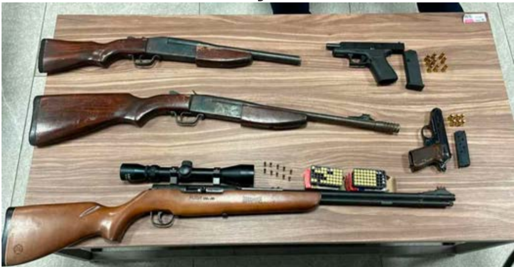
Los detenidos fueron cuatro hombres y dos mujeres, entre ellas una menor de edad, en posesión de tres armas largas y dos cortas, dos cargadores, así como noventa y cuatro cartuchos útiles de diversos calibres.

Puebla, Pue. En la colonia Santa Cruz Guadalupe, fueron detenidos seis sujetos, entre ellos dos mujeres, con armas de fuego, así como el aseguramiento de un vehículo.