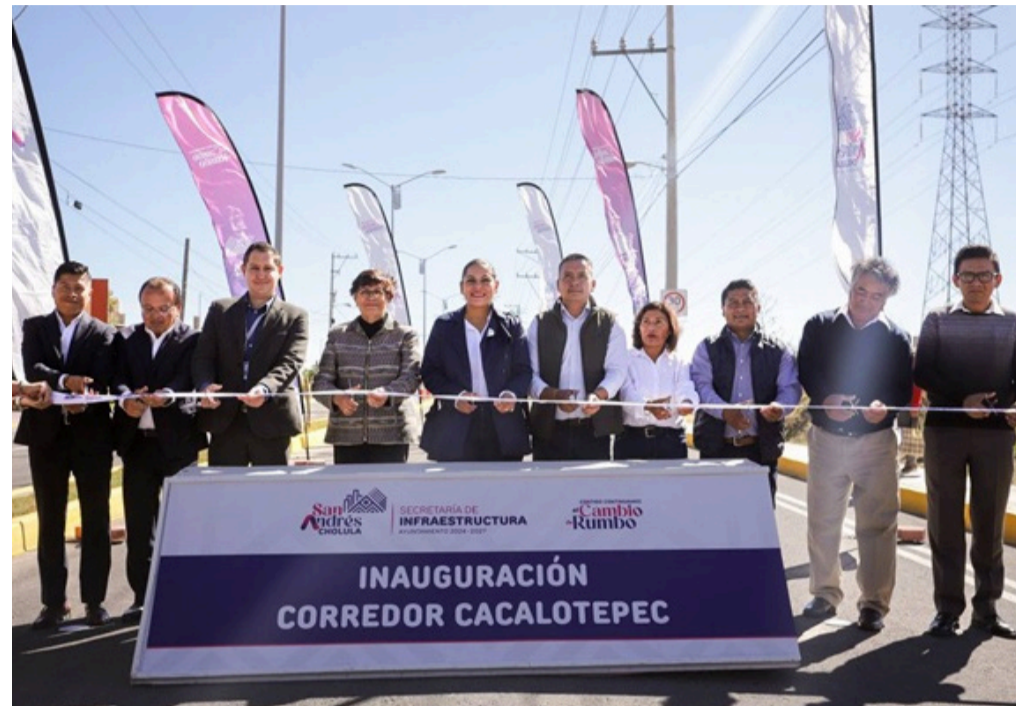
La obra contempló la construcción de 16 mil metros cuadrados de pavimento con concreto asfáltico con una inversión de 64.8 mdp.

Cabe destacar que la obra, iniciada en la administración anterior, consistió en la construcción de 16 mil metros cuadrados de pavimento con concreto asfáltico, así