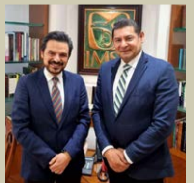
El gobernador Alejandro Armenta encabezó una reunión con los titulares de la Secretaría de Salud y el IMSS-Bienestar Puebla.

El titular del Poder Ejecutivo comentó que la administración estatal dará un ingreso a fondo perdido para que los concesionarios puedan realizar la adquisición de vehículos electrónicos y renovar sus unidades.