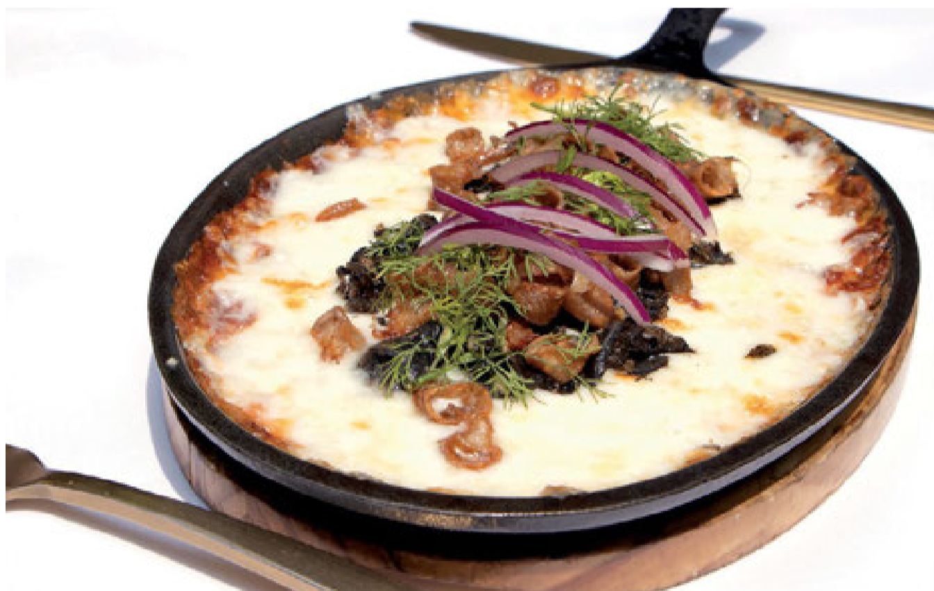
UNA DE LAS ENTRADAS MÁS SOLICITADAS es el queso fundido con huitlacoche y chicharrón de tripa.