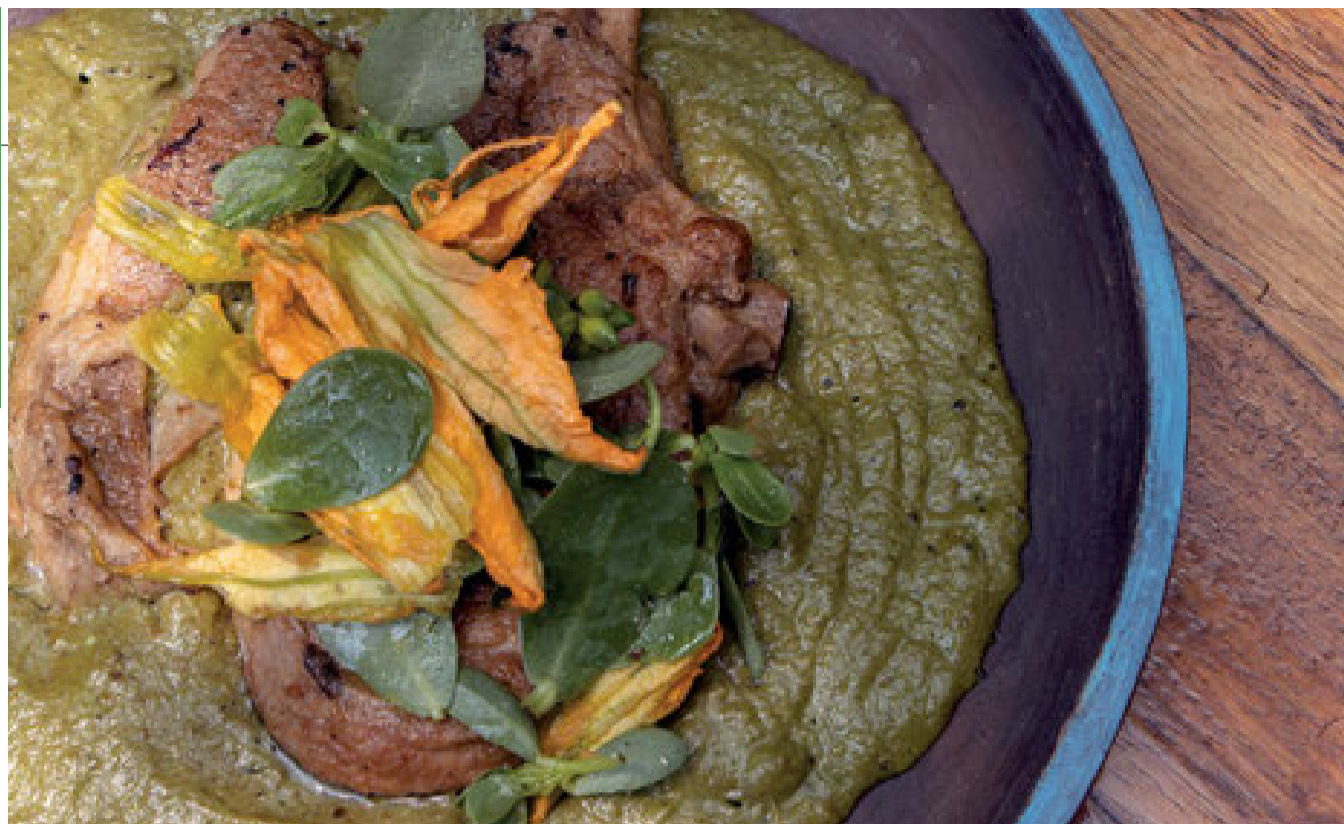
CHULETÓN DE CERDO EN MOLE VERDE acompañado de flor de calabaza y tortillas hechas a mano.