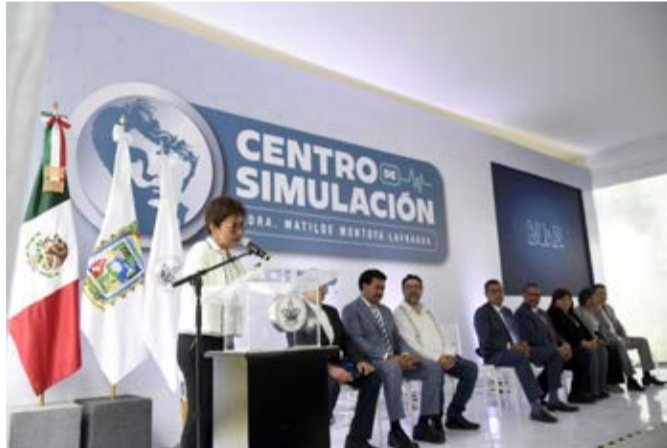
El gobernador Sergio Salomón Céspedes anunció una inversión conjunta con la BUAP- de casi 250 millones de pesos para las preparatorias Emiliano Zapata y Lázaro Cárdenas

trabajando con la universidad y anunció una inversión conjunta -gobierno de Puebla y BUAP- de casi 250 millones de pesos para edificaciones en las preparatorias Emiliano Zapata y Lázaro Cárdenas, así como del comedor universitario.