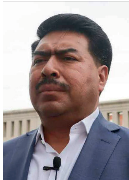
Actualmente han recibido 44 solicitudes, sin embargo, solamente en 22 casos los candidatos tienen medidas de protección, debido a la gravedad que representan.

"Todas son atendidas, el tema es que en algunos momentos, requieren de una mayor acompañamiento, sin embargo, todas y cada una han sido atendidas, desde el primer momento en que se presentan, esto en congruencia a la necesidad de que el gobierno del estado, el gobierno federal y los municipios demos acompañamiento", refirió. •SILVINO CUATE