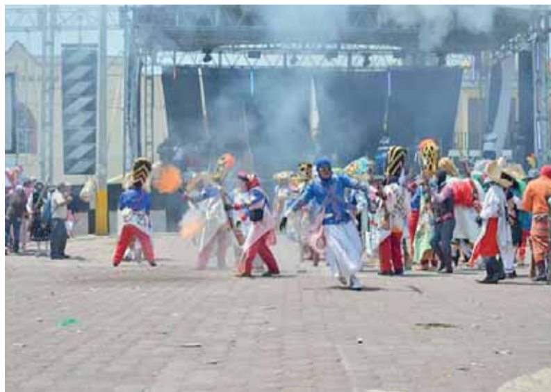
EL DESFILE Y REPRESENTACIÓN de la batalla de 1862 congrega a cientos de danzantes de Teotlalcingo, Chiautzungo e incluso Huejotzingo.