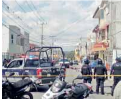
EL INCIDENTE ocurrió en la calle Álvaro Obregón, adelante del parque del Chamizal.

Por último, los presuntos responsables se dieron a la fuga y trascendió que otra mujer resultó herida.