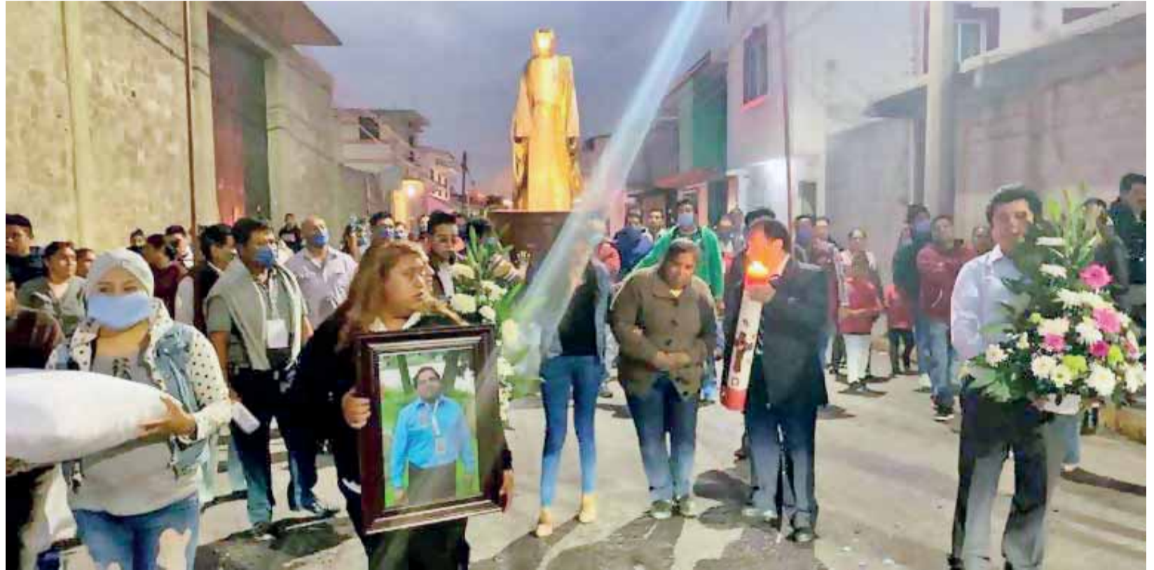
LAS TIENDAS Y comercios aledaños al centro de abastos también realizan sus actividades como hasta antes de la contingencia.

►La instalación de los altares monumentales no se ha suspendido