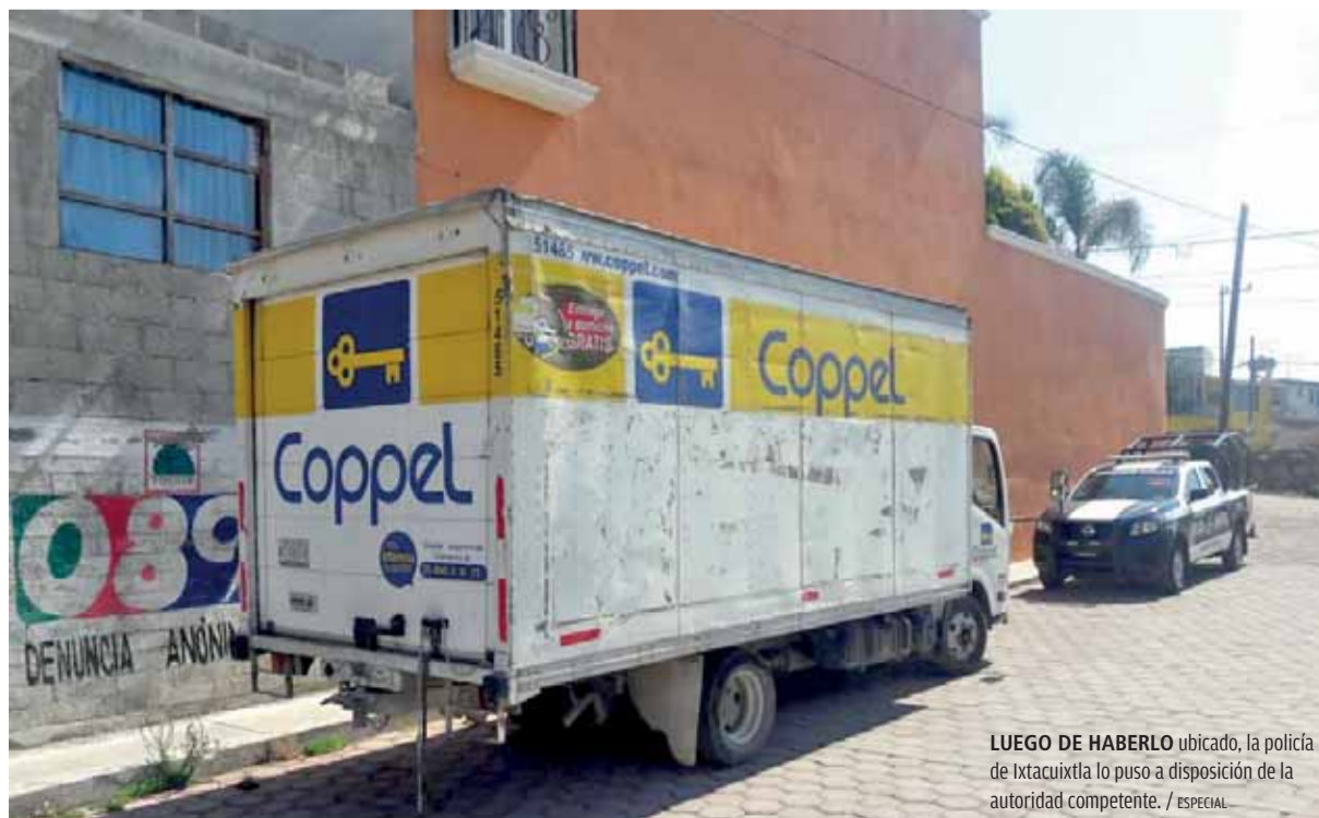
LUEGO DE HABERLO ubicado, la policía de Ixtacuixtla lo puso a disposición de la autoridad competente.

Sin embargo, tras el robo los delincuentes huyeron hacia Tlaxcala, donde se montó un operativo que permitió ubicar la unidad en la calle Benito Juárez de Ixtacuixtla.