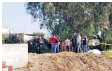
EL HECHO OCURRIÓ sobre un camino de terracería que conduce al cerro Totolquemec. / ESPECIAL

Policías municipales, paramédicos de la Cruz Roja y agentes de la Fiscalía General del Estado (FGE), se trasladaron a la zona y confirmaron que se trataba del cuerpo de un hombre de aproximadamente 45 años de edad y para realizar el levantamiento del cuerpo.