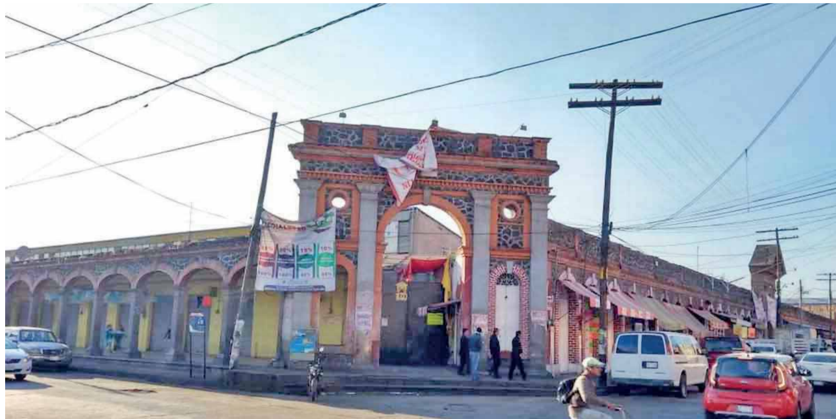
MÁS DE MIL comerciantes están obligados a mantener sus áreas de trabajo desinfectadas, además de que utilizarán cubrebocas y guantes de látex.

► Locatarios iniciaron con las medidas de sanidad dentro del centro de abasto para prevenir contagios de Covid-19