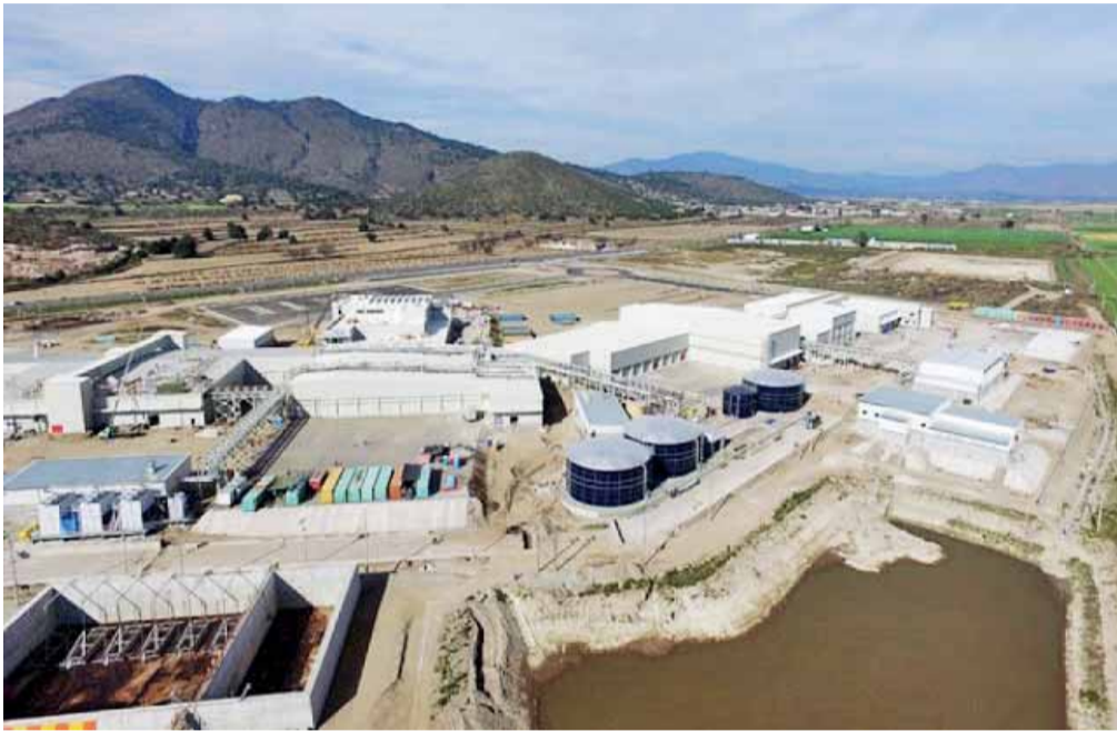
PIDEN AL GOBIERNO estatal que haga cumplir el estado de derecho.

► Un grupo de personas invadió tierras propiedad de la empresa en el municipio de Cuyoaco