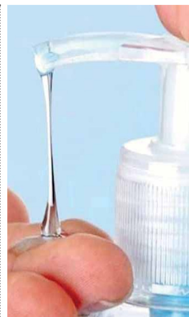
LAS AMAS DE CASA denunciaron que el alcohol puro de caña, el precio por litro pasó de los 25 a los 60 pesos en una semana.

La mesa directiva señaló que diariamente, los más de mil comerciantes están obligados a mantener sus áreas de trabajo desinfectadas, además de que utilizarán cubrebocas y guantes de látex sobre todos aquellos quienes prepararán alimentos.